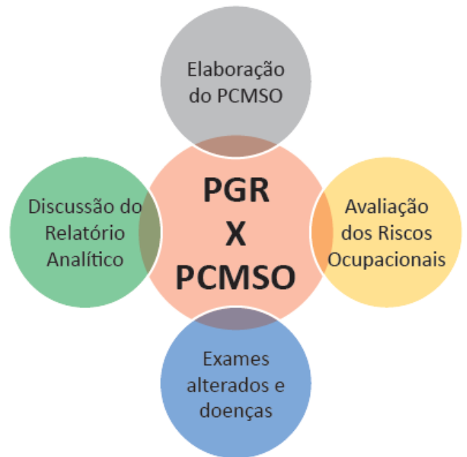
Figura 1 Integração do PGR ao PCMSO

5. Elaboração do plano de ação: as informações compiladas no relatório analítico são valiosas para o embasamento da inserção de um plano de ação que, se necessário, deverá ser evidenciado na próxima revisão do PGR e PCMSO.